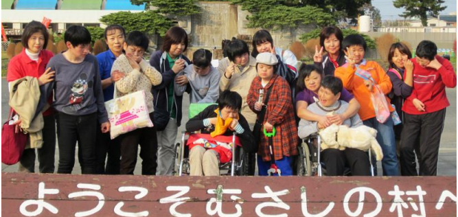
ようこそおさしの村へ