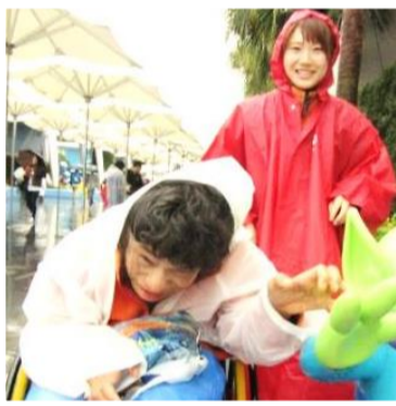
雨の中、絆が深まったかも

ハロウィーンシーズン。ご利用者とディズニールランドへ行くことができました。待ちに待った外出でも生憎の雨。それでもディズニールランドへ行くことができました。待ちに待った外出でも生憎の雨。それでもディズニールランドへ行くことができました。