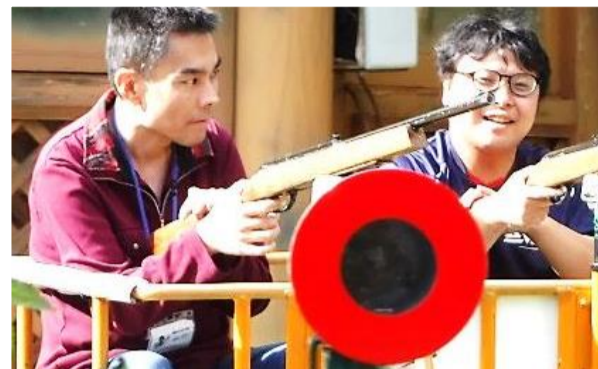
射的ゲームや乗馬、他にもたくさん楽しい体験ができました。