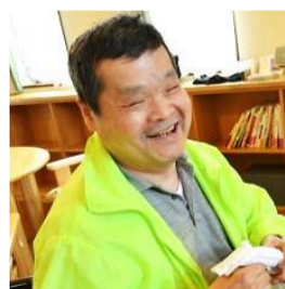
美味しさに大満足！

食事会、楽しみました。美味しかったです。食事会、楽しみました。美味しかったです。食事会、楽しみました。美味しかったです。