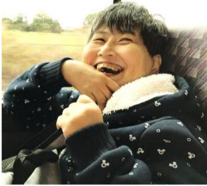
バスの中から、楽しくって♪

大洗水族館に行きました。新鮮なお魚の姿が、舌鼓を打つほどおいしかったです。大洗水族館に行きました。新鮮なお魚の姿が、舌鼓を打つほどおいしかったです。