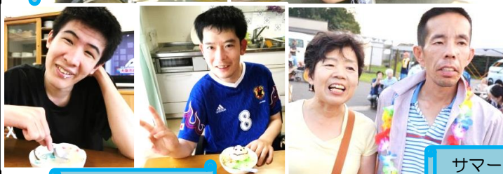
猛暑で暑気払い サマーフェスティバル