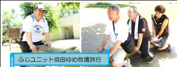
ふじユニット成田ゆめ牧場旅行