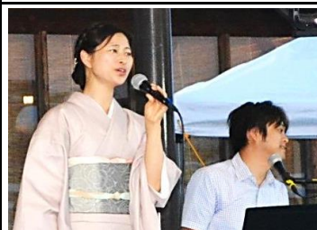
素敵な歌を、ありがとうございます。