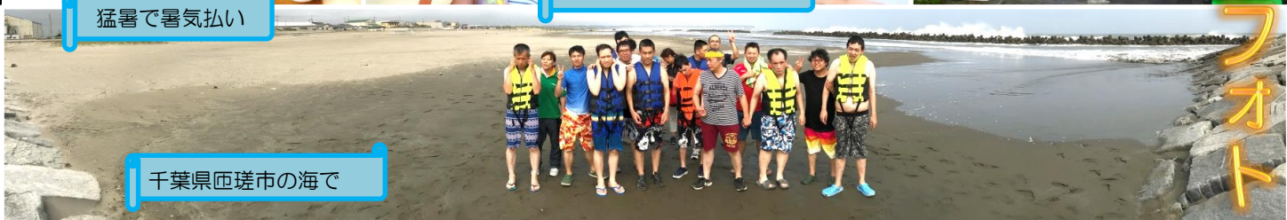
千葉県匝瑳市の海で