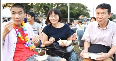
親子の楽しいひとときですね。

だバサ 思ごんス ン顔中例 とときアにわ いや気と例連 さルマ 来い利のテ今トが、のの日てそッよせグわは温な年日今 いに、年ます。者家バはなと、花ももば、す生リーで熱落まり三の年の フは、す。の、族、ににま、し印う上ら、い氷、の、そのム。かか夕遅をフエス ごエ、さら、良ごな、い友り暑た。的、笑、ち何フ数しな、し、思、温、だ、け、が、熱 期ス、に、の、い、の、出、に、加、が、サ、マ、ー、フ、エ 待テ、に、の、い、の、出、に、加、が、サ、マ、ー、フ、エ くイ、に、の、い、の、出、に、加、が、サ、マ、ー、フ、エ パ、ワ、ー、ア、ッ、プ、し、た 親子の楽しいひとときですね。