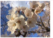
施設近隣の満開の桜