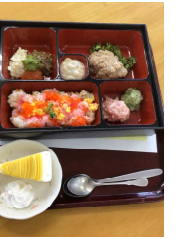
旬の物を使った食事を頂きました！