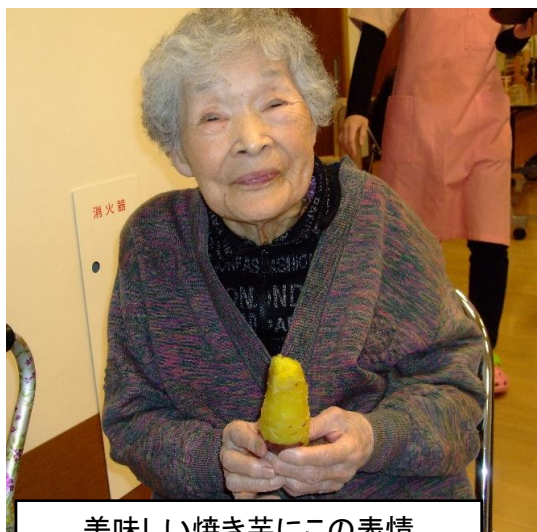
美味しい焼き芋にこの表情