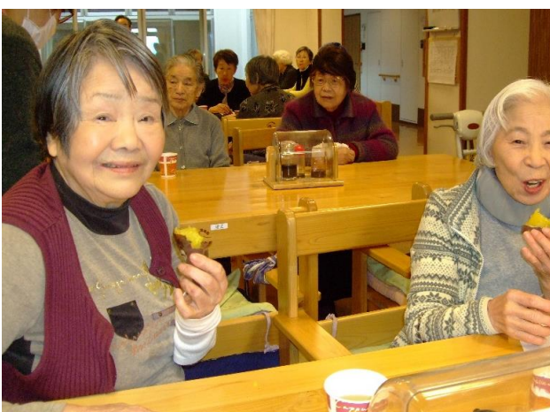
皆さまで食べる楽しいひととき