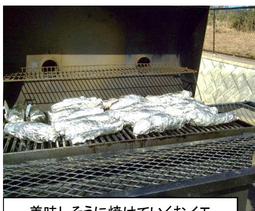
美味しそうに焼けていくおイモ