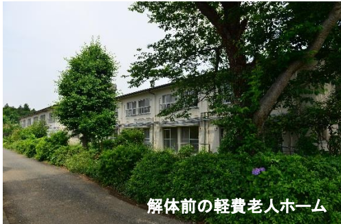
解体前の軽費老人ホーム